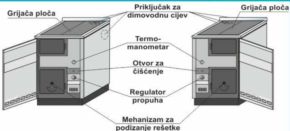
BIO-CET B 23/29 (izrađen u desnoj izvedbi)