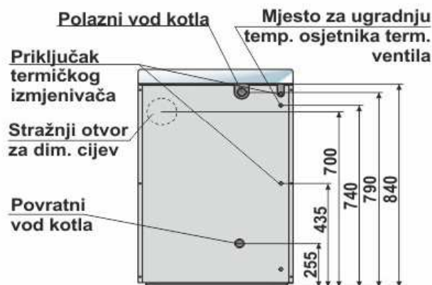
BIO-CET B 23/29 (izrađen u desnoj izvedbi)